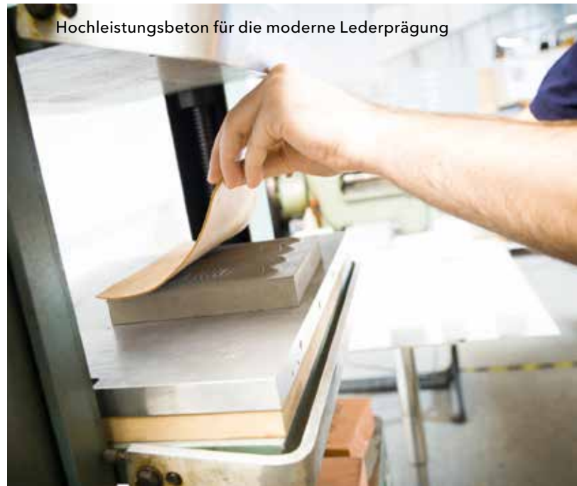
Hochleistungsbeton für die moderne Lederprägung