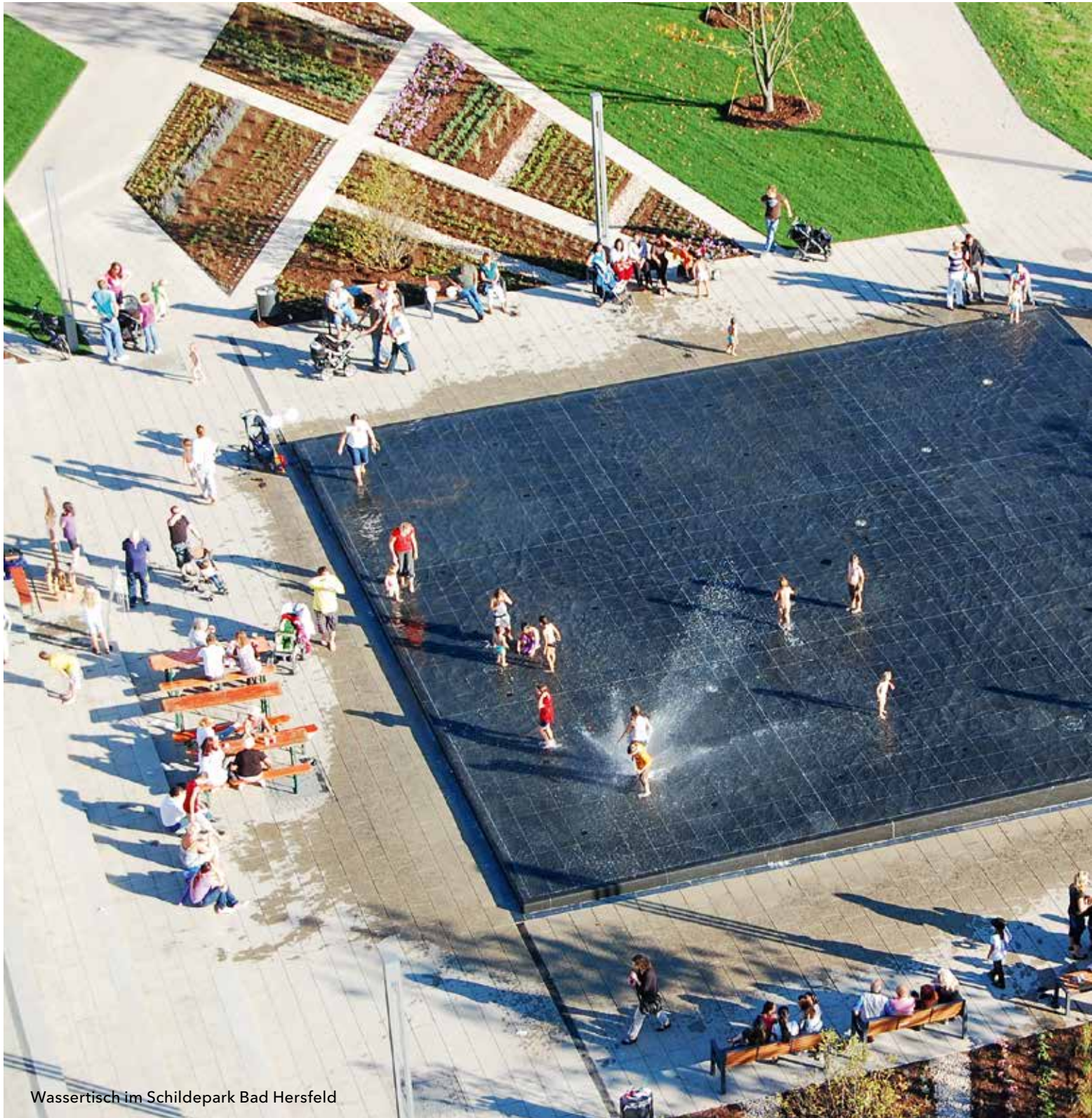
Wassertisch im Schildepark Bad Hersfeld