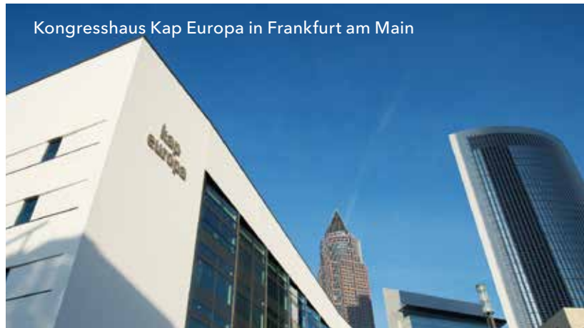
Kongresshaus Kap Europa in Frankfurt am Main

Für die Entwicklung des ländlichen Raums in Hessen stehen aus dem „Europäischen Landwirtschaftsfonds für die Entwicklung des ländlichen Raums (ELER)“ Fördermittel in Höhe von 318,9 Mio. Euro zur Verfügung. Verwaltet wird dieser Fonds im Hessischen Ministerium für Umwelt, Klima, Landwirtschaft und Verbraucherschutz (HMUKLV). Programmschwerpunkte des Entwicklungsplanes für den ländlichen Raum (EPLR) sind die Bereiche: Wettbewerbsfähigkeit der Landwirtschaft, nachhaltige Bewirtschaftung der natürlichen Ressourcen sowie die wirtschaftliche und räumliche Entwicklung der ländlichen Gebiete. Die ELER-Förderung und die EFRE-Förderung ergänzen einander. Eine gleichzeitige Förderung derselben Ausgaben aus EFRE und ELER ist ausgeschlossen.