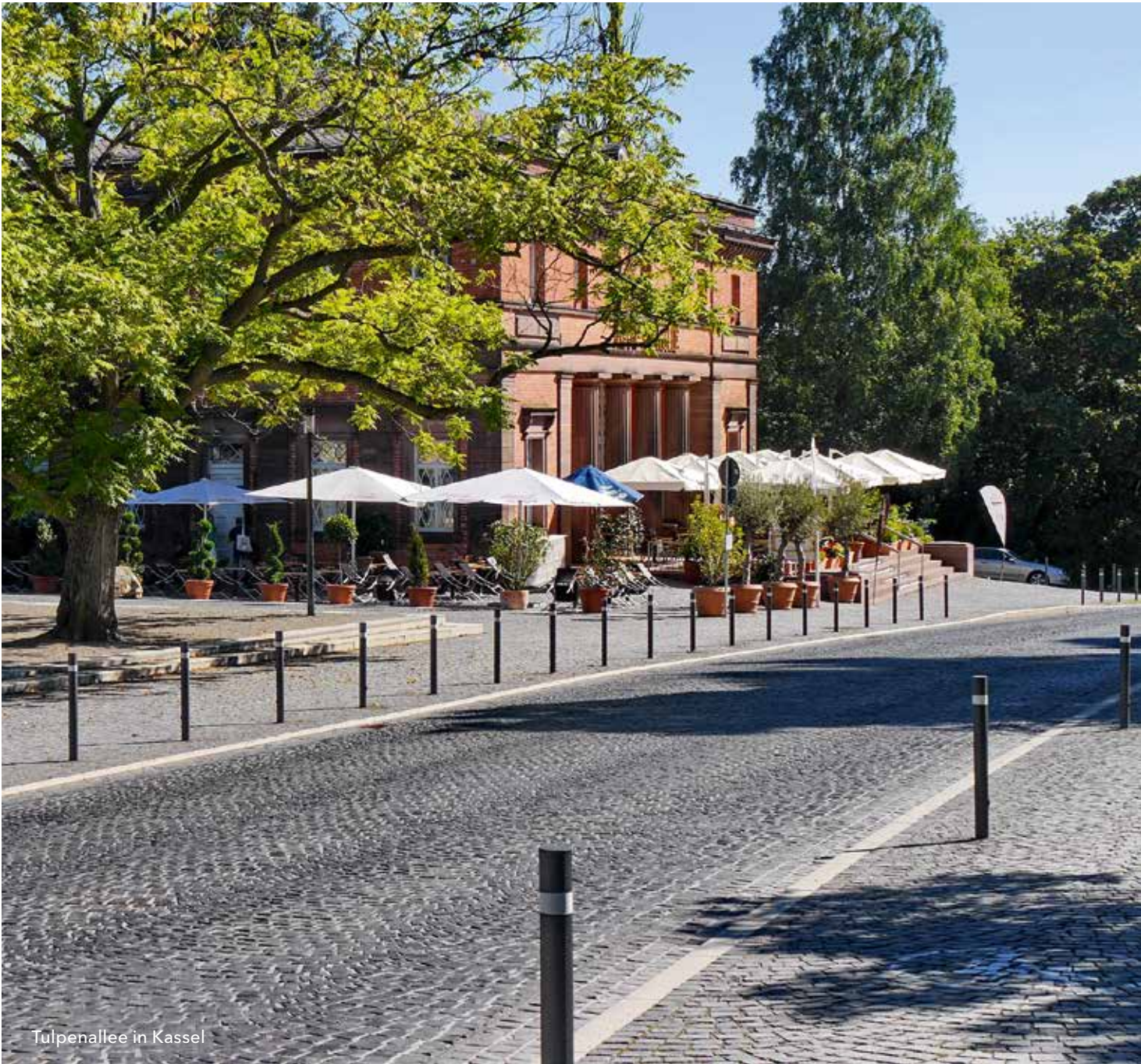
Tulpenallee in Kassel