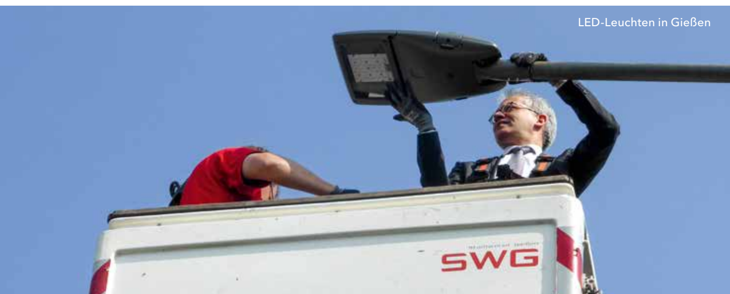
LED-Leuchten in Gießen

Ziel ist eine sichere, umweltschonende, bezahlbare und gesellschaftlich akzeptierte Energieversorgung. Als Zwischenschritt soll erreicht werden, dass Hessen bis zum Jahr 2020 ein Viertel seines Stromverbrauchs aus erneuerbaren Quellen deckt.